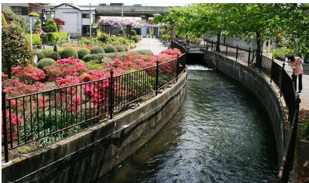
市民に楽しみと潤いを与える水路