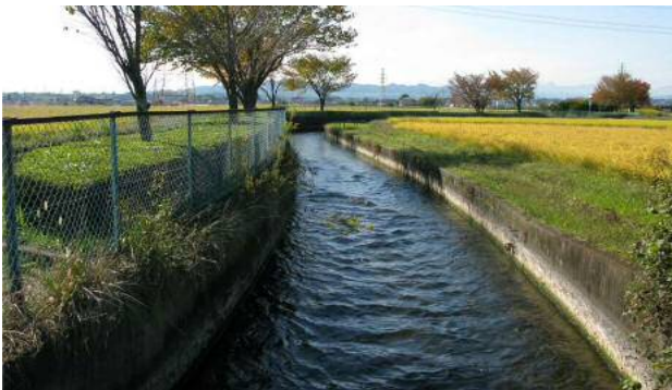
収穫期を迎えた長野堰用水