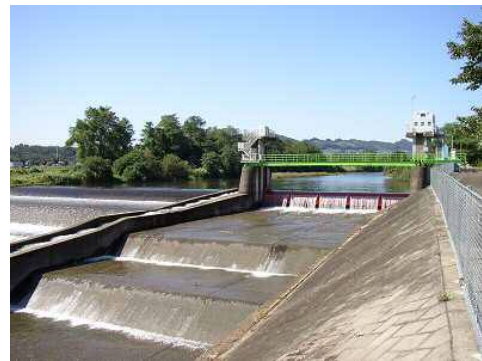
水源である烏川左岸に設置された頭首工