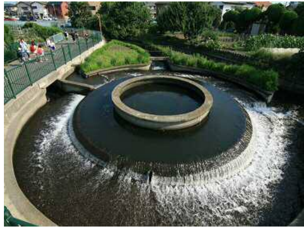
昭和37年に設置された円筒分水堰

■ その後、隧道や簡易水道も設置され、最盛期には1700haの水田を灌漑。これにより、5万人分の食料と10万人分の飲料水を供給すると共に、高崎城のお堀などを潤し、衛生面や市民生活の向上に寄与した。